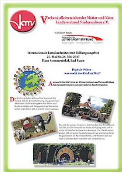
Internationale Familienfreizeit 2017